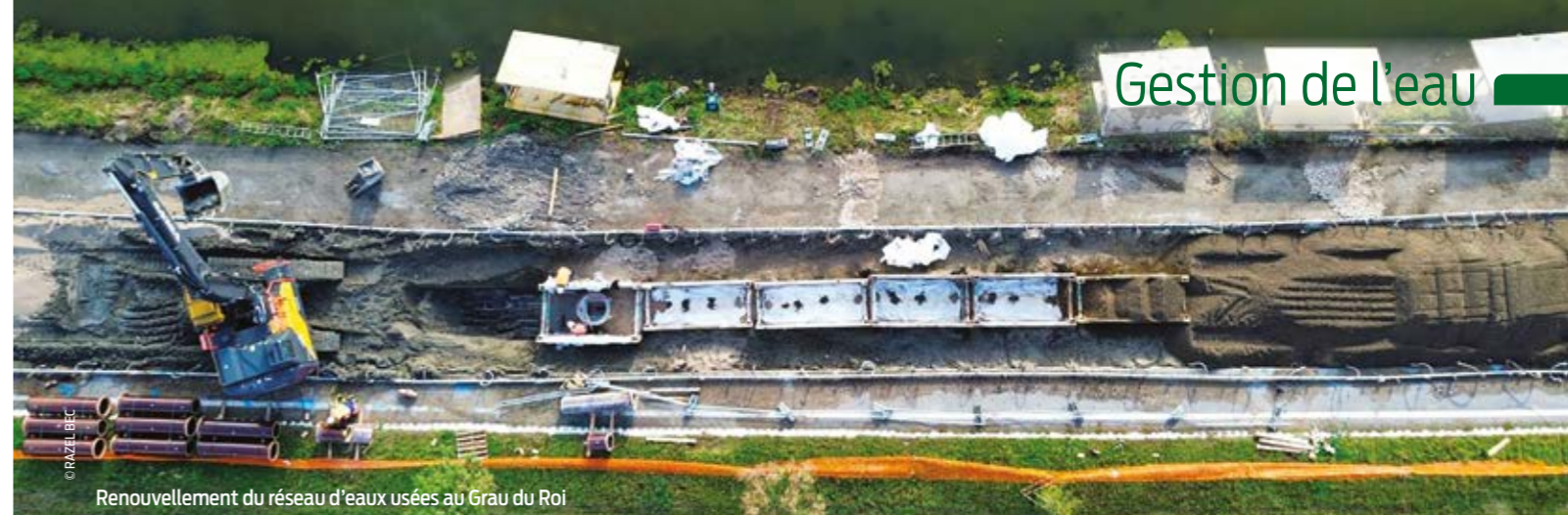
Renouvellement du réseau d'eaux usées au Grau du Roi

En cas de vente d'une maison non raccordée au réseau collectif, le diagnostic assainissement est obligatoire et doit dater de moins de 3 ans. Si des travaux de réhabilitation sont nécessaires, ils peuvent faire l'objet de négociations avec le futur acquéreur mais doivent être réalisés au plus tard un an après la signature de l'acte de vente.