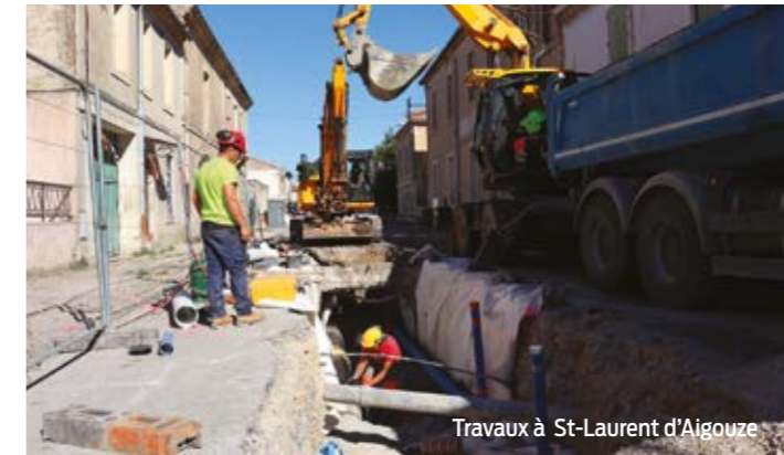
Travaux à St-Laurent d'Aigouze

La deuxième phase est programmée du 23 septembre 2024 jusqu'au 25 avril 2025. Le chantier ira de la rue des Camisards en passant par l'impasse des Berges du Vidourle, jusqu'au rond-point de la piscine, soit 1,39 km de canalisation. Une partie des travaux se