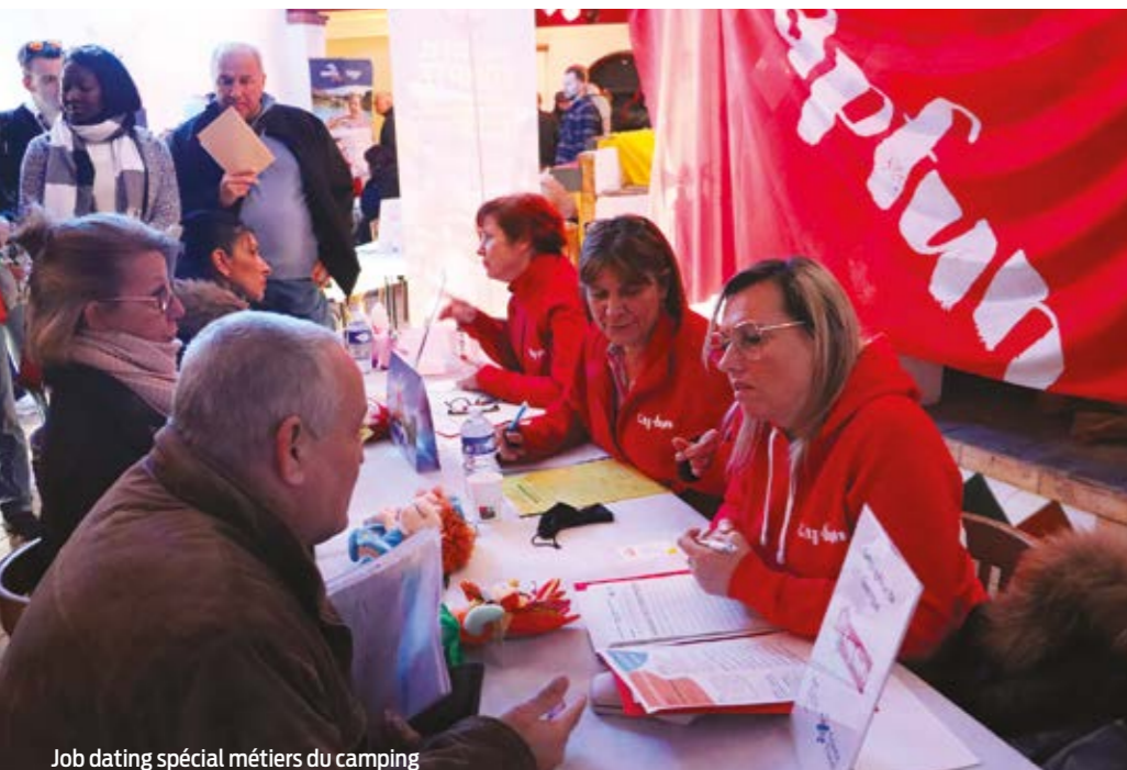
Job dating spécial métiers du camping

Le service emploi Terre de Camargue et France Travail Vauvert mobilisent services et actions pour être au plus près des demandeurs d'emploi du territoire.